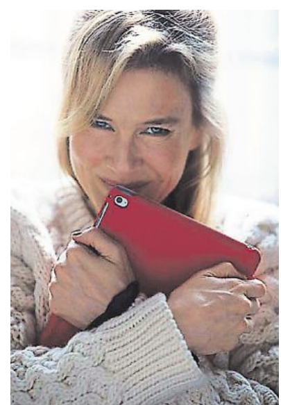
« Bridget Jones baby ».

Gaumont multiplexe, 1, avenue des Droits-de-l'Homme Brice 3 : 11 h, 15 h 05, 17 h 45. Bridget Jones baby : 19 h 20, 22 h 20. Cigognes et compagnie : 11 h, 13 h 40. Doctor strange : 10 h 45, 13 h 45 ; 3D : 19 h 45, 22 h 15 ; VO : 16 h 25. Inferno : 10 h 25, 13 h 25, 19 h 15, 21 h 55 ; VO : 16 h 10. Jack Reacher : never go back : 19 h 55, 22 h 25. L'Histoire de l'Amour : 10 h 15, 16 h 10, 19 h 10, 22 h 10 ; VO : 13 h 10. L'odyssée : 15 h 10. La fille du train : 19 h 25, 22 h 30. La folle histoire de Max et Léon : 10 h 30, 12 h 55, 15 h 25, 17 h 50, 20 h 15, 22 h 30. Les Trolls : 10 h 30, 13 h 15, 15 h 25, 17 h 35. Ma famille t'adore déjà : 11 h, 13 h, 15 h 30, 17 h 35, 19 h 45, 21 h 55. Ma vie de courgette : 13 h 15. Miss Peregrine et les enfants particuliers : 10 h 15, 13 h 45, 16 h 25. Mr Wolff : 19 h 10, 21 h 55. Radin ! : 10 h 45, 12 h 55, 17 h 20.