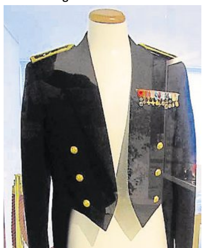
Musée. Exposition temporaire //s

sortent de leur réserve . Présentation d'objets, de coiffures, d'effets vestimentaires, de décorations et récompenses, de fanions brodés et d'une tenue de gala pour officier des années 1950. Du vendredi 11 au dimanche 13 novembre , 13 h 30 à 18 h, 106, rue Éblé. Contact : 02 41 24 83 16, museedugeniemilitaire@orange.fr, www.musee-du-genie-angers.fr