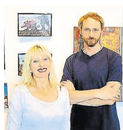
Saint-Lazare, à Angers. Entrée libre. Tél. : 06 63 24 56 18.

De vendredi 11 à dimanche 20 novembre , de 10 h à 12 h 30 et de 14 h 30 à 19 h, du mardi au vendredi ; de 11 h à 18 h, le week-end, à la chapelle Saint-Lazare, 60-66, rue