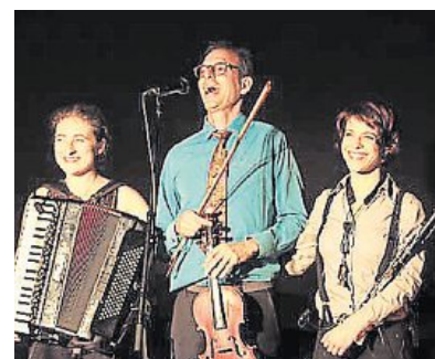
Vendredi 11 novembre , à 21 h, T'es Rock Coco, 16, rue Beaurepaire. Tarif : 5 €. Tél. 02 41 25 00 44.